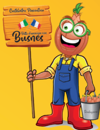
Patto d'amicizia con BUSNES

Pranzo Apertura Stand Gastronomici a cura della Proloco di Castelvetro Pia- centino