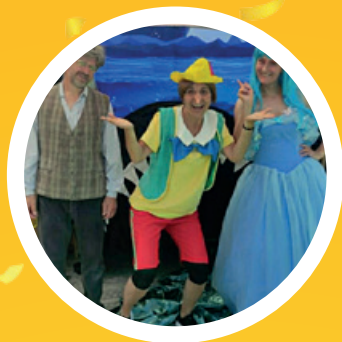
Compagnia teatrale SENTICHIPARLA In Pinocchio un burattino come te